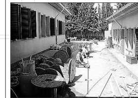
Mejoras en la accesibilidad del IES.

Las actuaciones afectan a distintos edificios e incluso se debe optar por construir la rampa de acceso al instituto. En las diferentes construcciones se realizarán obras en los baños adaptando cada uno de ellos. Las escaleras y algunas de las rampas existentes también se deben modificar para adecuarlo todo a la normativa vigente de accesibilidad. A la vez, en la salida de emergencia también se construirá una rampa. El proyecto también incluye la puesta en funcionamiento del ascensor existente y la adaptación con una rampa. La actuación de accesibilidad del centro es una de las obras previstas por la Conselleria en el Plan de Infraestructuras Educativas 2016-2023.