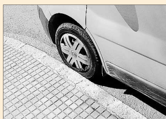
Los vehículos aparcados no tienen que ser impedimento para pintar las líneas.

INCA. Al llegar el buen tiempo salen los colores por todas partes y lo mismo ocurre en Inca. Estos días las líneas amarillas que impiden aparcar aparecen en los puntos más inesperados de la ciudad. Al parecer, se pintan sin una previsión por parte, por ello, si hay un coche aparcado se hace lo que se puede.